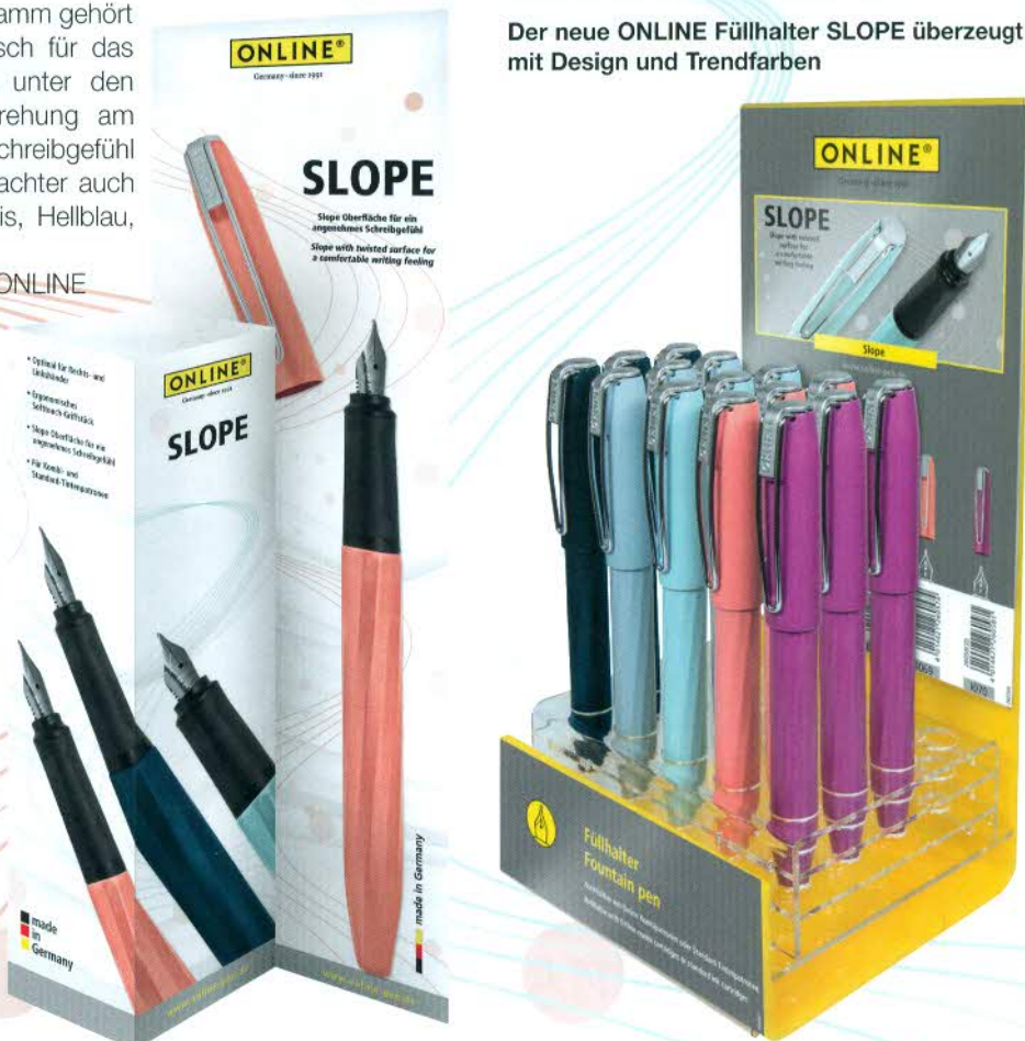
Im Aufsteller werden die neuen SLOPE Füllhalter zugriffsfreundlich präsentiert. Links das Pop-Up Display

Der neue ONLINE Füllhalter SLOPE überzeugt mit Design und Trendfarben