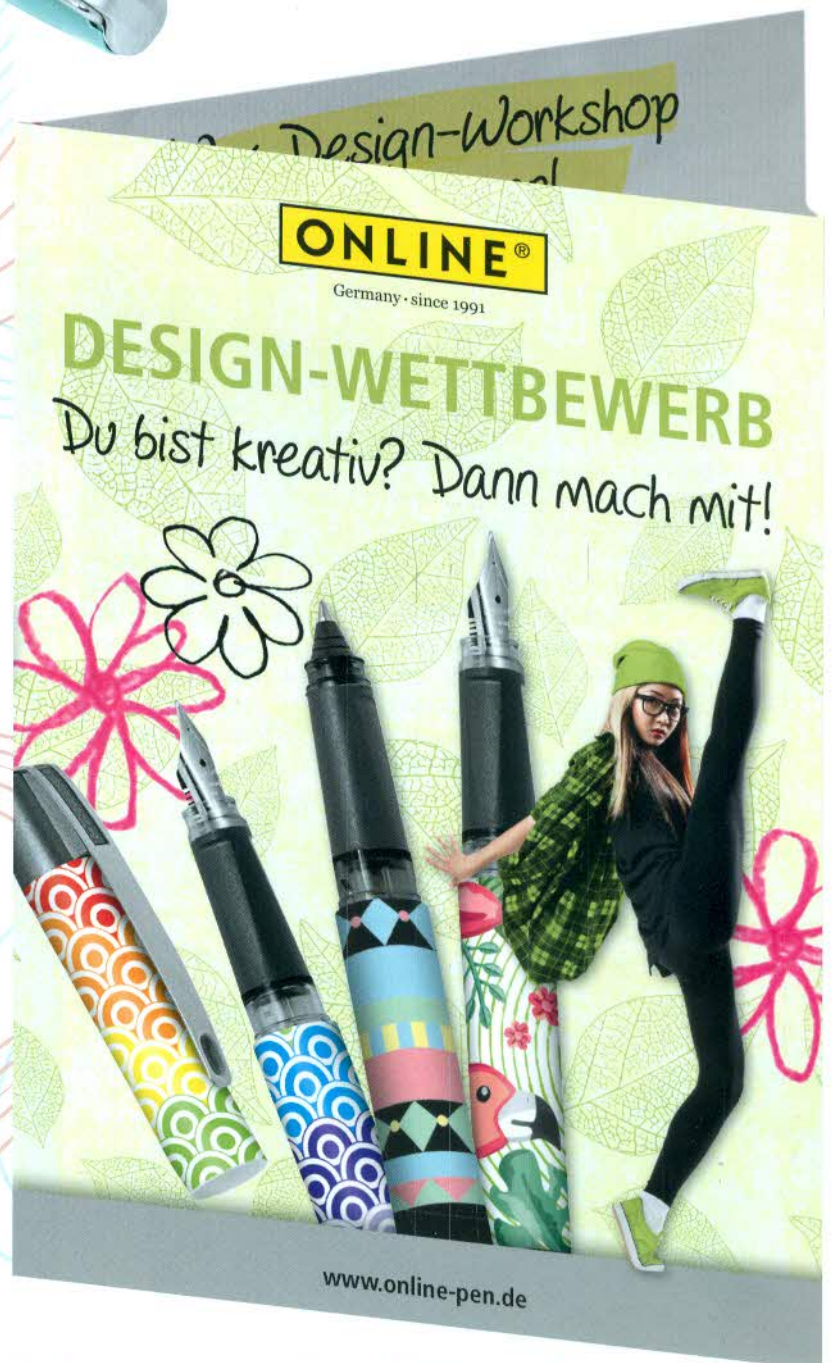
Das Schaufensterposter zur Neuheit SLOPE sowie die Einladung zum Design-Wettbewerb

Weitere Infos finden Sie unter www.online-pen.de .